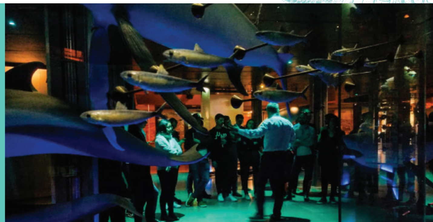
Séminaires habitat bio-inspiré à la grande galerie de l'évolution du Muséum National d'Histoire Naturelle de Paris avec Tarik Chekchak

MOTS CLÉS : biomimétisme, maîtrise d'œuvre, matériaux, façade, bâtiment, approche fonctionnelle & écosystémique, éco-conception.